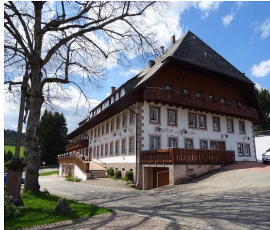
Hotel & Gasthaus Traube Waldau

Alle Zimmer sind mit DU/WC/Fön/TV u. gratis WLAN