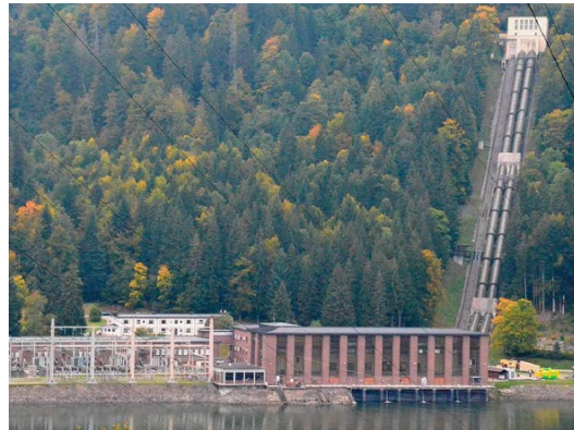
Kraftwerk Häusern am Schluchsee