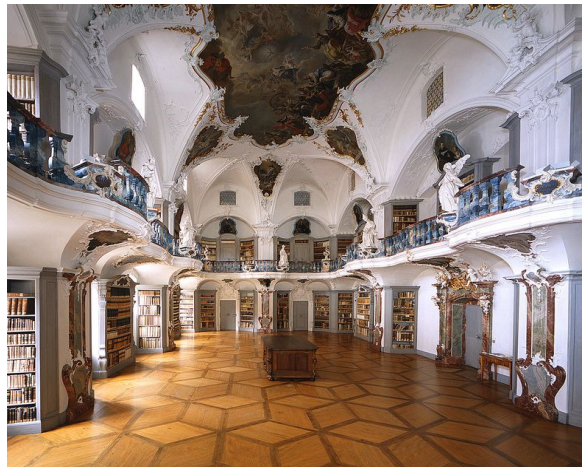
Bibliothek Kloster St. Peter

Mittwoch: 9.00Uhr Abfahrt vom Hotel nach Furtwangen.Führung im Uhrenmuseum von 9.30-10.30 Uhr. Anschließend zu den Triberger Wasserfällen und weiter ins Gutachtal zum Vogtsbauernhof. Dort erhalten wir so gegen 13.30 Uhr eine 1 stündige Führung. Es besteht auch die Möglichkeit, sich je nach Appetit zu stärken.Ich denke dass es dann für diesen Tag reicht.