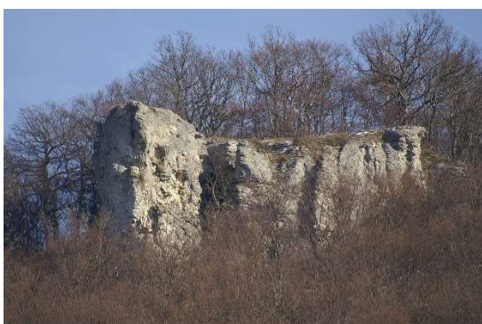
Tiersteinfelsen mit Sicht auf.....

Der Ort Gosbach wird erstmals 1143 in einer Bestätigung der Güter des Klosters Anhausen/Brenz erwähnt. Der helfensteinische Ort kam mit Wiesensteig 1806 an Württemberg und war bis 1810 beim Oberamt Wiesensteig, danach bis 1938 zum Oberamt Geislingen und gehörte bis zum Zusammenschluß mit Bad Ditzenbach im Zuge der Germeindereform als selbständige Gemeinde zum Landkreis Göppingen.