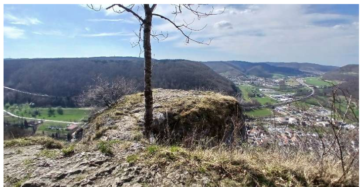
.....auf Gosbach und Gruibingen